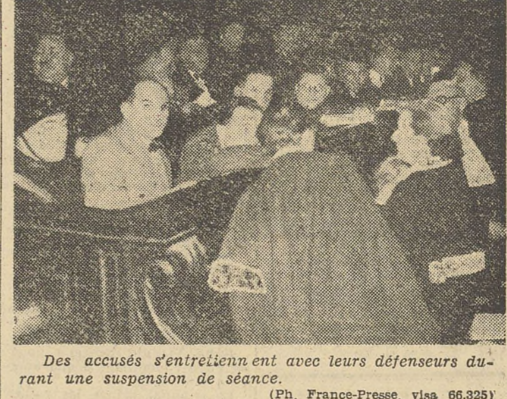
Des accusés s'entretenant avec leurs défenseurs durant une suspension de séance.

LE PROCÈS des ex-députés communistes se poursuit à huis clos Les accusés ont suscité divers incidents de procédure qui n'ont pas été pris en considération PAR LE TRIBUNAL MILITAIRE