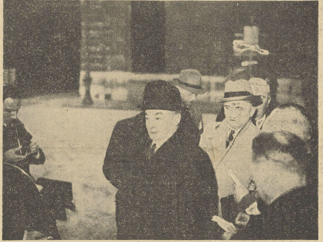
M. Paul REYNAUD, entouré de journalistes et de photographes, sort de l'Élysée