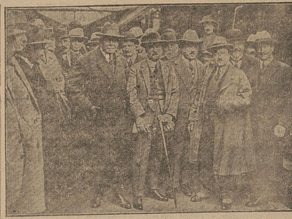
Les membres de la délégation française à leur départ pour l'Amérique