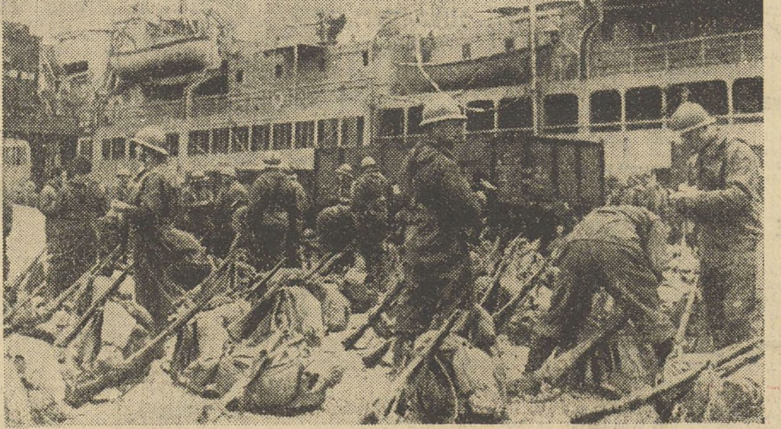
Dans un port de France, préparatifs d'embarquement d'une partie du corps expéditionnaire à destination de la Norvège.