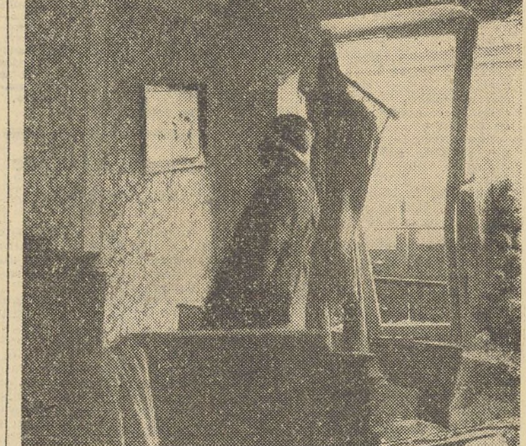
Vue intérieure d'une maison bombardée

La journée d'hier, au cours de laquelle l'action de l'aviation a été absolument nulle, en raison du mauvais temps, a été marquée par un violent combat local dans la région à l'ouest des Vosges.