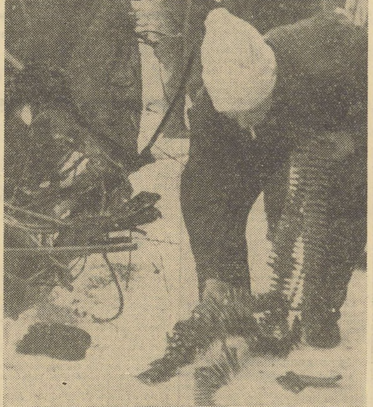
Bandes de mitrailleuses extraites d'un avion russe abattu par les Finlandais.

Londres, 3 février. Le correspondant du Daily Telegraph à Stockholm, se dit en mesure de révéler que, non seulement des avions américains, mais aussi des avions anglais, tous de types appropriés au climat septentrional, sont arrivés en Finlande et y ont été employés pendant ces derniers 15 jours. Leur nombre, écrit-il, n'atteint pas celui des avions russes (400) et les envois de pilotes, la plus sinistre période de la guerre aérienne pour la Finlande sera surmontée. Les avions anglais, ajoutent-ils, ont déjà établi leur supériorité sur les appareils russes. Les avions anglais de combat