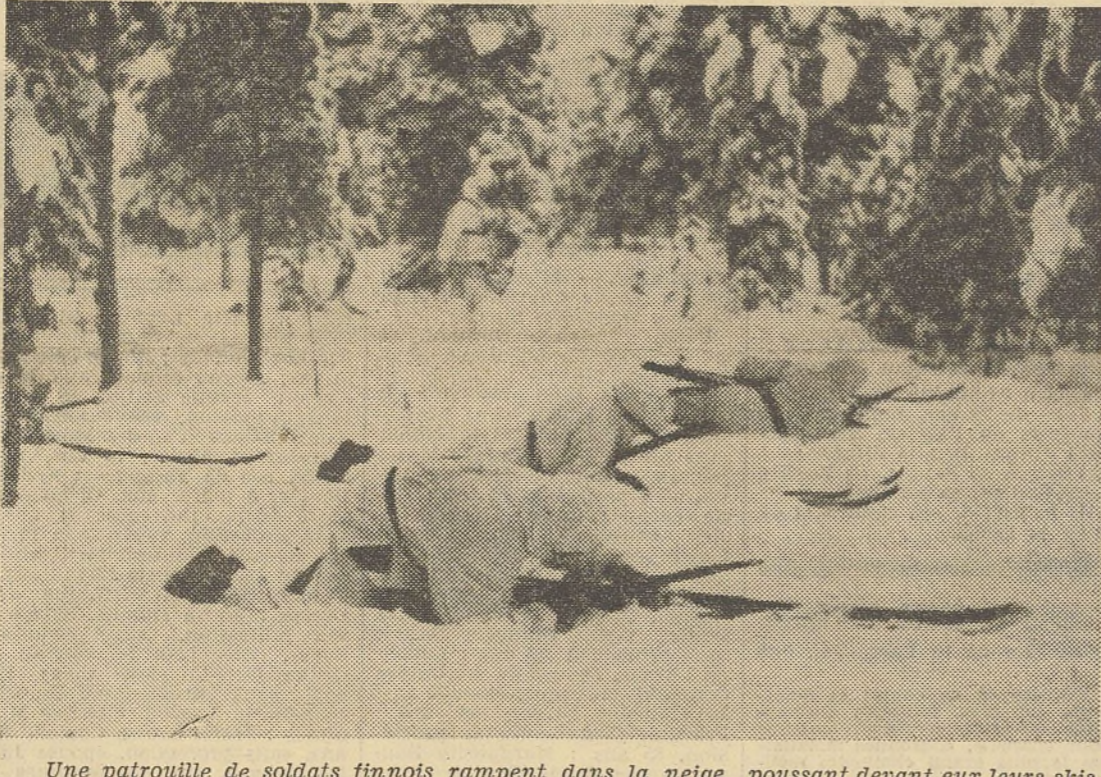
Une patrouille de soldats finlandais rampent dans la neige, poussant devant eux leurs skis

Au cours de nombreux raids sur les villes ouvertes 19 appareils soviétiques ont été abattus