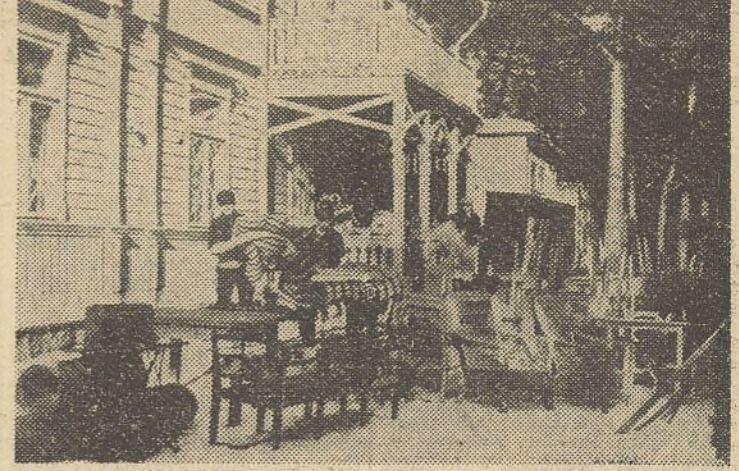
Les Finlandais évacuent Hangö avant l'arrivée des Russes. On sait que les troupes russes devaient occuper dans la nuit de vendredi à samedi la ville de Hangö, qui leur a été cédée à bail par le récent traité finno-soviétique. Voici des habitants de Hangö s'empressant de déménager leurs meubles avant le délai fixé.