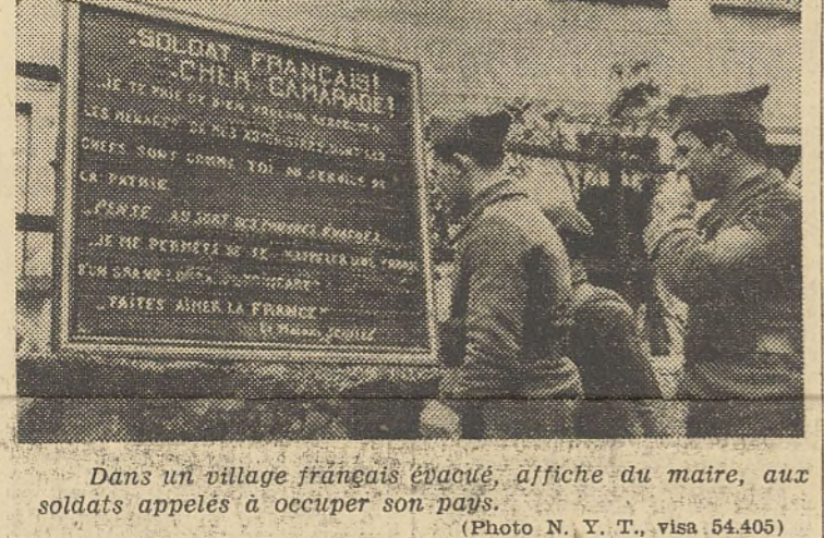
Dans un village français évacué, affiche du maire, aux soldats appelés à occuper son pays.

Paris, 23 mars. Commentant le vote d'hier de la Chambre, et la décision du cabinet de rester en fonction, l'Œuvre écrit : Le résultat a été tel que M. Paul Reynaud s'est posé la question de savoir s'il devait rester, ou s'en aller. Il a décidé de rester, et il a bien fait, puisqu'il avait la majorité absolue, et que, du moment qu'il le pouvait, il devait éviter une crise nouvelle. Il avait même la majorité large, si on ne tient pas les abstentions pour hostiles — et on est sûr parfaitement en droit de le faire, puisque les abstentionnistes donnent à leur abstention un sens d'indication... mais d'indications si diverses, qu'ils sont susceptibles de donner à la décision, et qu'on n'est pas capable de prendre la sienne ? Qu'on réclame de l'énergie, mais qu'on réclame aussi de la sagesse, qu'on exige qu'on ne sache ce qu'on veut, et qu'on ne le sait pas soi-même ? Déjà les abstentions de mardi, par lesquelles on a renversé Daladier sans le renverser tout en le renversant, signifiaient, paraît-il, qu'on attendait de lui des méthodes nouvelles et « des actes ». Quelles résolutions hardies