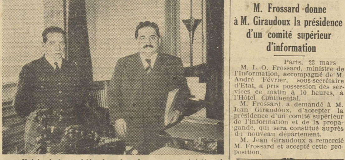
Voici photographiés dans leur bureau, au ministère de l'Air, M. Laurent EYNAC, nommé ministre de l'Air en remplacement de M. Guy La Chambre, et le colonel MENY, sous-secrétaire d'Etat aux fabrications de l'air.

Paris, 23 mars. Le premier Comité de guerre du gouvernement de M. Paul Reynaud s'est tenu ce matin, au ministère des Affaires étrangères, sous la présidence du président du Conseil. Assistaient à la réunion du Comité de guerre : MM. Paul Reynaud, Camille Chautemps, Daladier, Campinchi, Laurent-Eynac, Georges Monnet, Lamoureux, C. Mandel, Daubry, le général Gamelin. Le Comité de guerre s'est prolongé de 10 heures du matin à midi et demi. M. Edouard Daladier, ministre de la Défense nationale, avant de se rendre au Comité de guerre s'est longuement entretenu avec le général Gamelin.