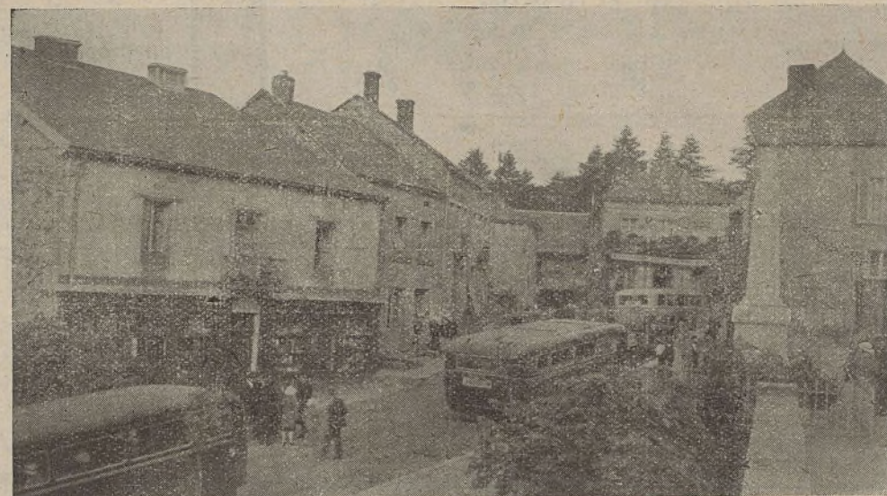
Anost (S.-et-L.). — Une vue du bourg.

A quatre kilomètres d'Anost, au sud, sur un monticule raide, escarpé et couronné de grands arbres, au bas duquel se dressent les ruines de l'antique forteresse féodale des seigneurs de Roussillon ; entourée sur trois faces par de profondes vallées, elle n'était accessible que du côté du nord où une large tranchée avait été faite ; on prétendait même que la forteresse était reliée par un souterrain à la rivière au moyen duquel on abrégeait les chevaux ; elle fut ruinée en 1412 par les Armagnacs.