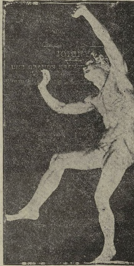
LE FAUNE (Œuvre de Lequesne) MUSÉE DE NEVERS

En Grèce, au temps des vendanges, les jeunes gens s'amusaient à s'élever sur une outre de vin pleine, copieusement hui-