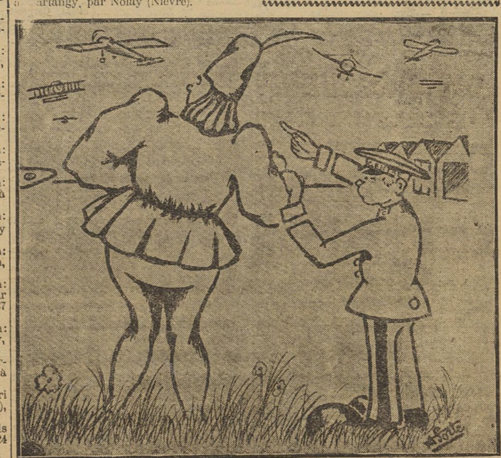
Oui, c'est bien l'aéroplane !!!