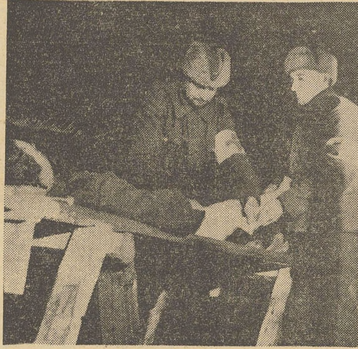
Les premiers soins sont donnés à un blessé sous une tente installée dans les bois de Salla.

Une division soviétique a été écrasée De nombreux prisonniers ont été capturés ainsi qu'un immense butin