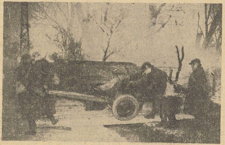
Mise en place d'une pièce antichars.

Paris, 8 janvier. Calmes complets sur terre et dans les airs sur le front de l'Ouest. Un brouillard dense, une pluie continue ont sévi, hier, toute la journée, dans la zone des opérations. Ces mauvaises conditions météorologiques ont interdit toute activité aérienne et ont même gêné le déroulement habituel des opérations de patrouilles et de reconnaissances. On ne peut signaler dans les airs que la randonnée d'un appareil allemand au-dessus de la région de l'est de la France. Sur terre, deux patrouilles allemandes se sont glissées jusqu'aux abords d'un des petits postes avancés français de la région boisée à l'ouest des Petites-Vosges. Elles l'ont attaqué à la grenade. Les agresseurs ont été facilement repoussés par les occupants de la position française.