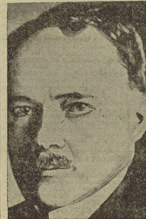
Krupp von Bohlen