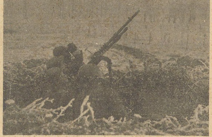
Poste de défense contre avions

Activité locale de patrouilles de part et d'autre. LES ARTILLERIES ADVERSEES ont exécuté des tirs intermittents sur presque tout le front