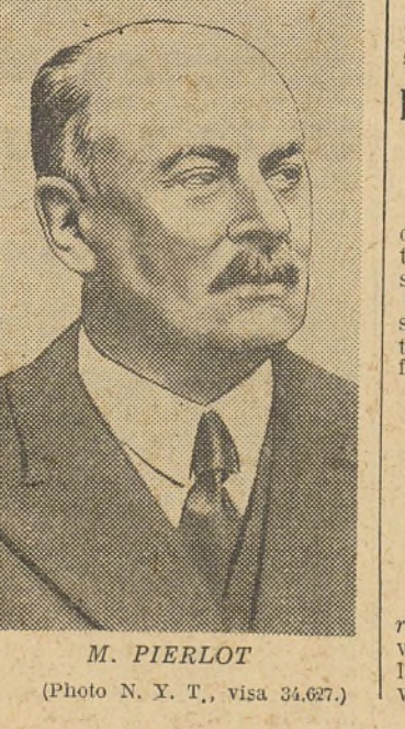
M. PIERLOT

Bruxelles 5 janvier. M. Pierlot a remis la démission collective du gouvernement. Le roi a chargé M. Pierlot de reconstituer le Cabinet. Dans les milieux politiques, on explique la démission du cabinet Pierlot par le souci du premier ministre de s'assurer une plus grande liberté d'action en ce qui concerne le nombre et le choix de ses collaborateurs.