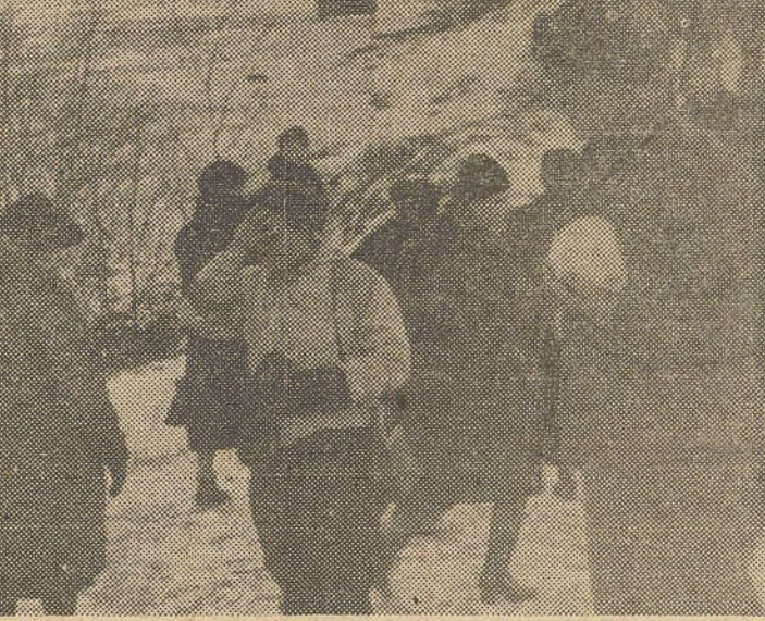
Femmes finlandaises sortant d'un abri après une alerte.

On n'a pas confirmé la destruction de la ligne ferrée de Mourmansk