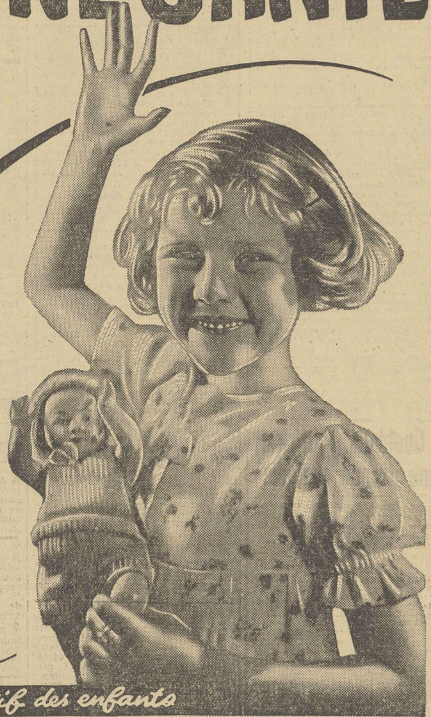
Le doux laxatif des enfants