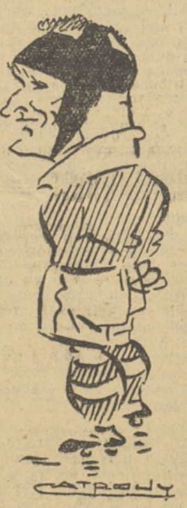
PLANU du R. C. Roanne