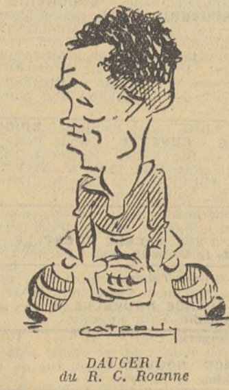
DAUGER I du R. C. Roanne

LA AMICALE DE CHATEAULOU La Coupe d'Hiver de l'U.F.O.L.E.P. est terminée. Nous allons tracer un rapide coup d'œil sur cette première partie de la saison.