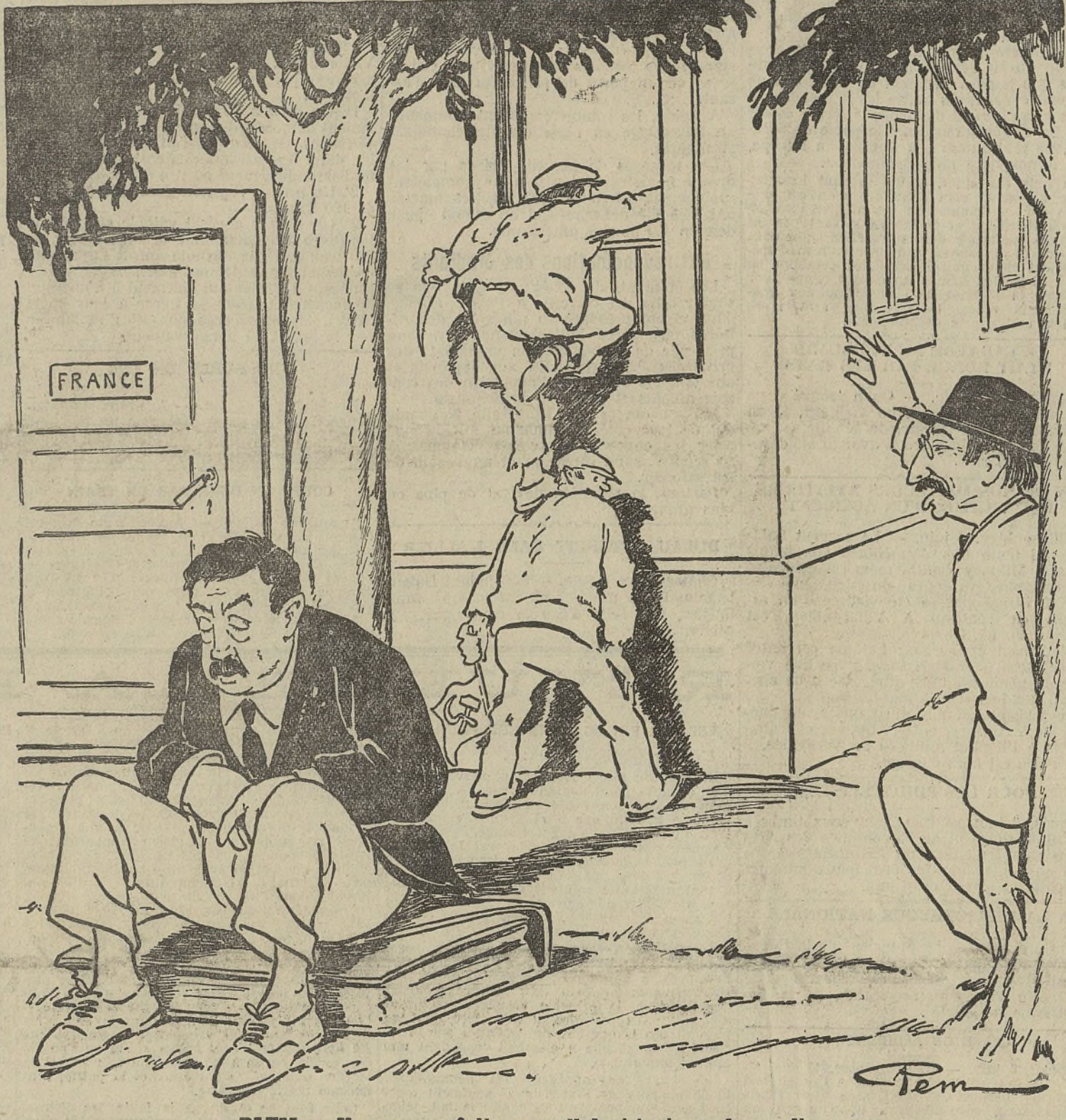
BLUM. — Ne vous en faites pas, il dort toujours le gardien.