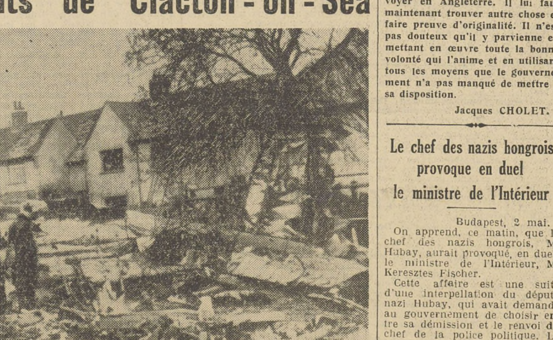
Une vue prise à Clacton-on-Sea, après la chute de l'avion allemand dont on aperçoit les débris parmi les décombres.