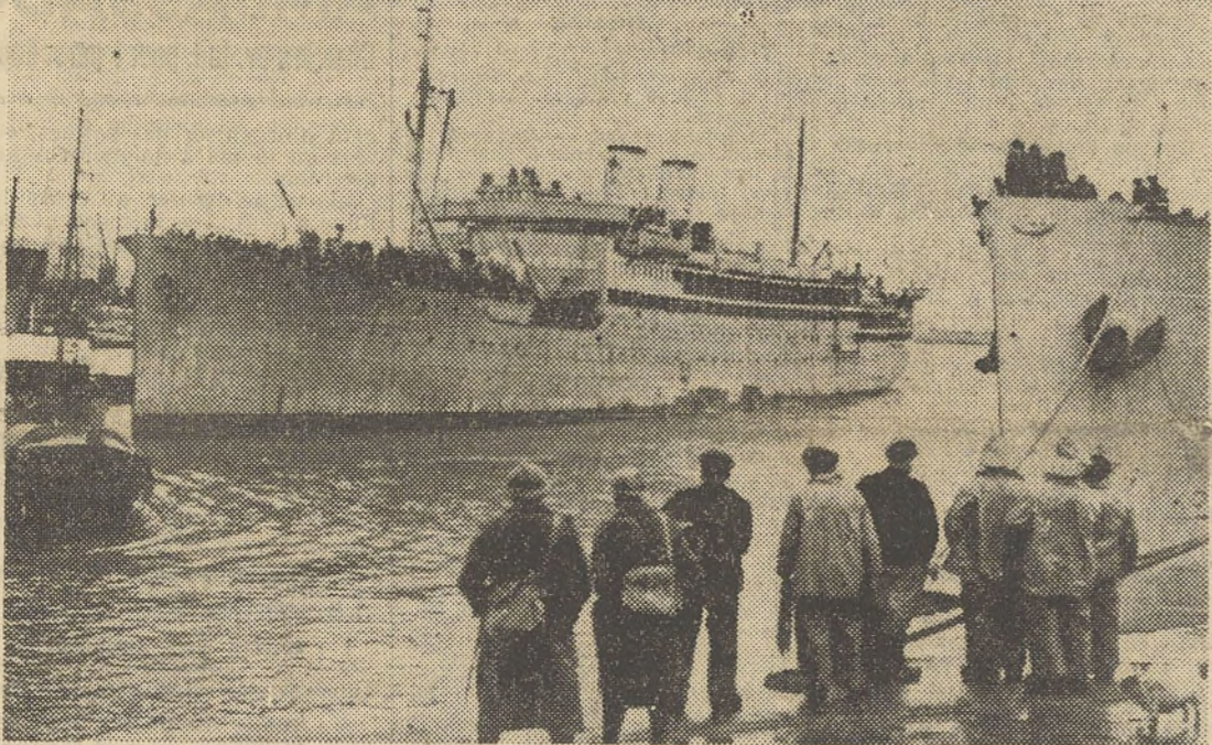
Un transport de troupes prêt à lever l'ancre dans un port français.