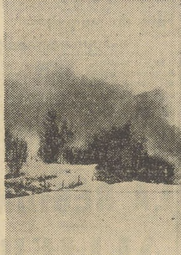
La vallée de Gudbrun où se sont livrés de furieux combats.

Les bases aériennes utilisées par les nazis : Stavanger, Fornabu et Aalborg sont l'objet de la part de la R. A. F. d'une série de raids écrasants