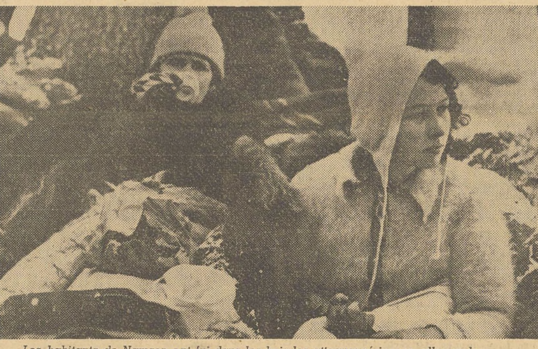
Les habitants de Namsos ont fui dans les bois les attaques aériennes allemandes.

Londres, 7 mai. La B. B. C. annonce d'Oslo que les Allemands auraient renoncé au transfert des prisonniers de guerre en Allemagne. Les prisonniers âgés de plus de 60 ans et de moins de 16 ans, seront libérés. Les autres seront employés à des travaux agricoles ou concentrés dans des camps de prisonniers. La B. B. C. ajoute : Les attaques allemandes contre des navires hôpitaux et des navires de passages continuent. Trois bateaux viennent d'être bombardés. Le navire hôpital « Dronning-Maud », a été atteint par deux bombes explosives et 37 infirmières ou malades ont été tués ou blessés. Le petit bateau à vapeur « Tordekild» a également été bombardé à bord se trouvaient surtout des femmes et des enfants, parmi lesquels des réfugiés finlandais ; deux bombes ont atteint le bateau, blessant deux personnes. Un troisième bateau de passagers a été bombardé, mais il n'y a pas eu de pertes de vie humaine à déplorer.