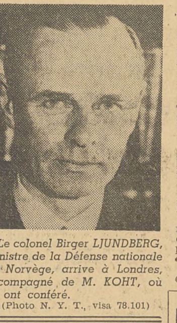
Le colonel Birger LJUNBERG, ministre de la Défense nationale de Norvège, arrive à Londres, accompagné de M. KOHT, où ils ont conféré.