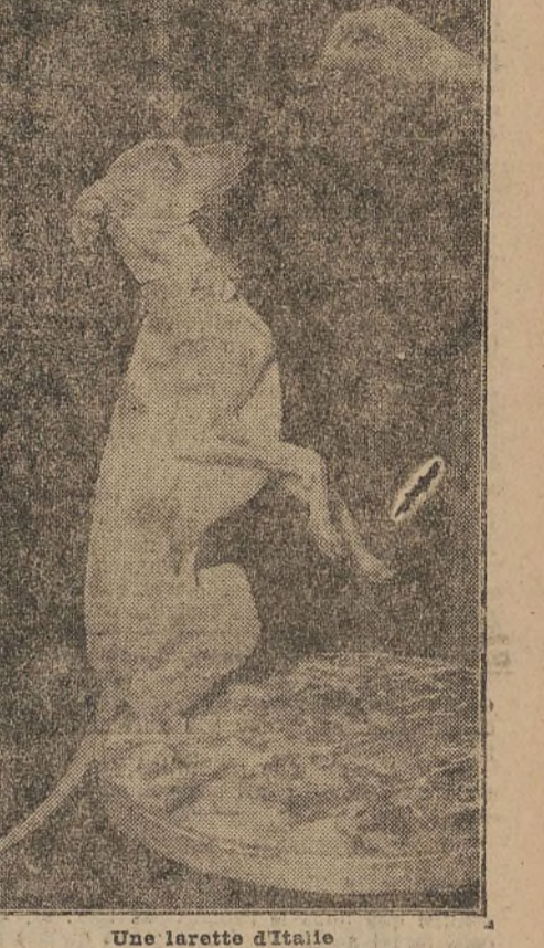
Une larvette d'Italie