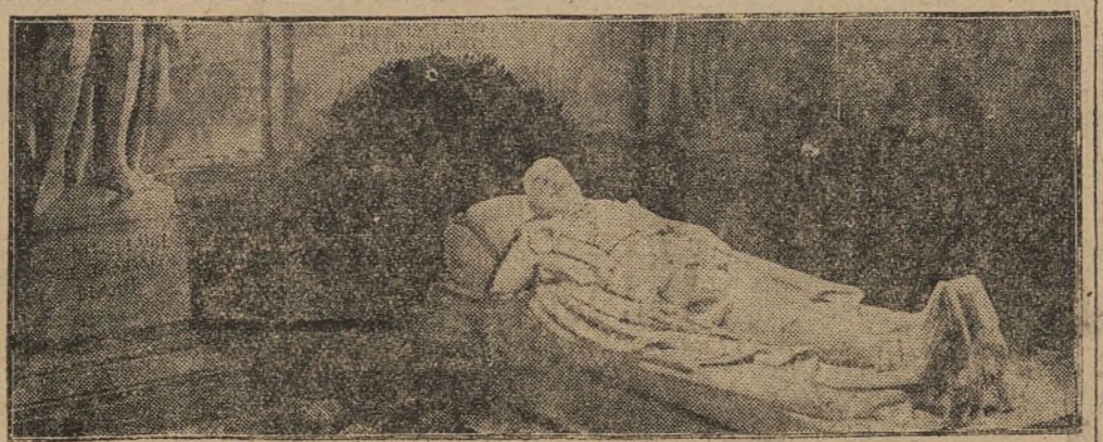
Le monument de lord Kitchener dans la cathédrale Saint-Paul à Londres

Le père a été mis en état d'arrestation.