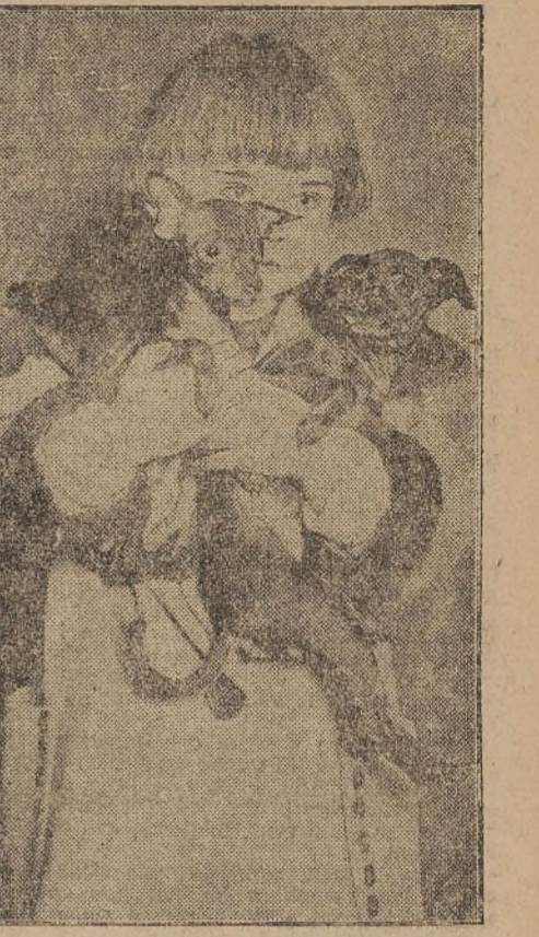
Jeune enfant et ses amis