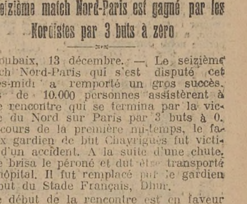
Le seizième match Nord-Paris est gagné par les Nordistes par 3 buts à zéro