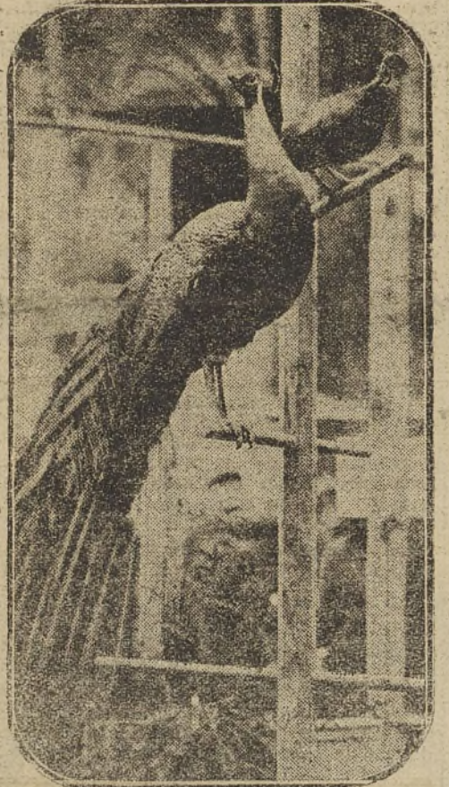
UN COUPLE DE PAONS EXPOSÉ

Un organisme existe donc maintenant; il est chargé d'examiner et de présenter