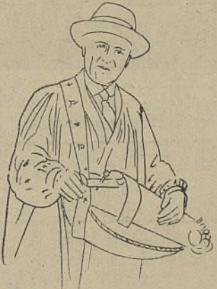
Joueur de Vielle en Morvan

Pour conclure ces courtes lignes nous souhaiterions de belles vacances à nos visiteurs, espérant qu'ils goûteront à loisir le charme prenant de nos enchantements oasis, dont ils garderont certainement un impérissable souvenir.