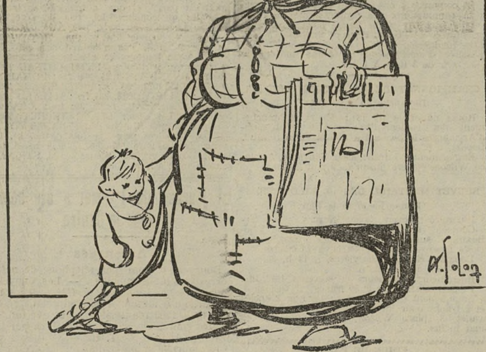
On m'appelle l'horionelle du faubourg (AIR CONNU) (Croquis inédit de Solon).