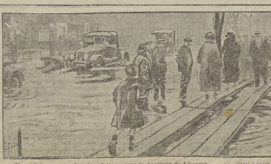
Les inondations dans la banlieue de Lourdes

Ici ouvrons une petite parenthèse. La matière albuminoïde vivante de nos cellules — le « protoplasma », d'un mot — peut être, « grosso modo », considérée comme délimitant un foyer, au sein duquel brûlent les substances alimentaires que la digestion fait passer dans le sang et la lymphe: glucose et sucres isomères, corps gras, matières albuminoïdes à l'état de peptones. L'énergie produite par ces combustions alimentaires se répartit en deux portions: 1° Une partie purement « mécanique »; celle qui apparaît dans nos mouvements musculaires, volés, dans nos déplacements (parmi ces derniers figurent, au premier plan, les battements de notre cœur).