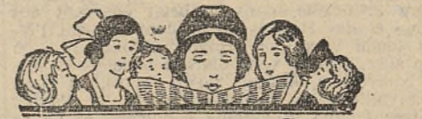
LIRE EN PAGE 2 Nos informations de Dernière Heure. Les Sports.