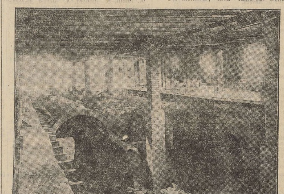
L'USINE A BRIQUES DE BEAUVAIS AVANT L'INCENDIE