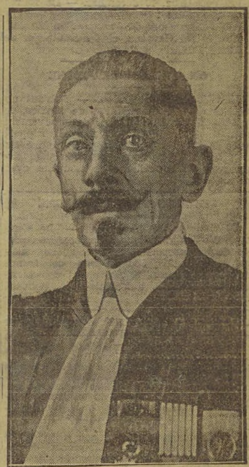
M. LE CONSEILLER PRESSARD Président des Assises

Paris, 19 décembre. — Au cours de l'enquête ouverte à la suite du vol de 300.000 francs commis la semaine dernière à la recette principale, rue du Louvre, une autre affaire relative à l'émission d'un chèque falsifié de 600 francs vient d'être découverte aujourd'hui.