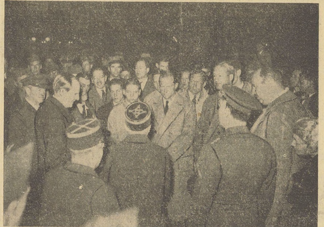
A leur arrivée à la gare de Lyon, à Paris, les volontaires de l'American Field Service sont reçus par les représentants du ministre de la Guerre.