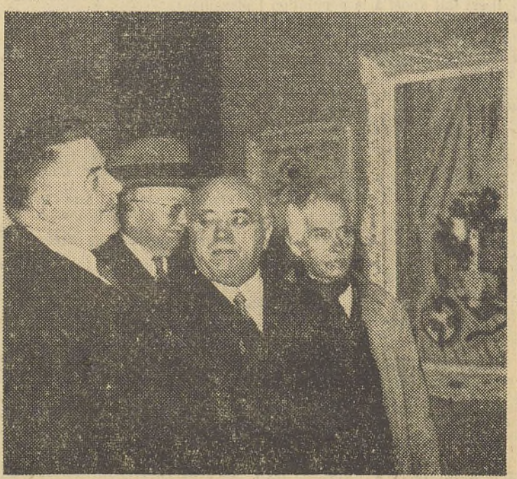
MM. HERRIOT, SARRAUT, ministre de l'Éducation nationale, et DE MONZIE, ministre des Travaux publics, à l'inauguration du Salon.