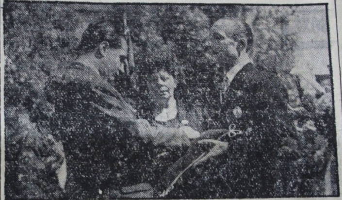
M. MITTERRAND épingle la croix de guerre sur le coussin brodé qui lui est présenté